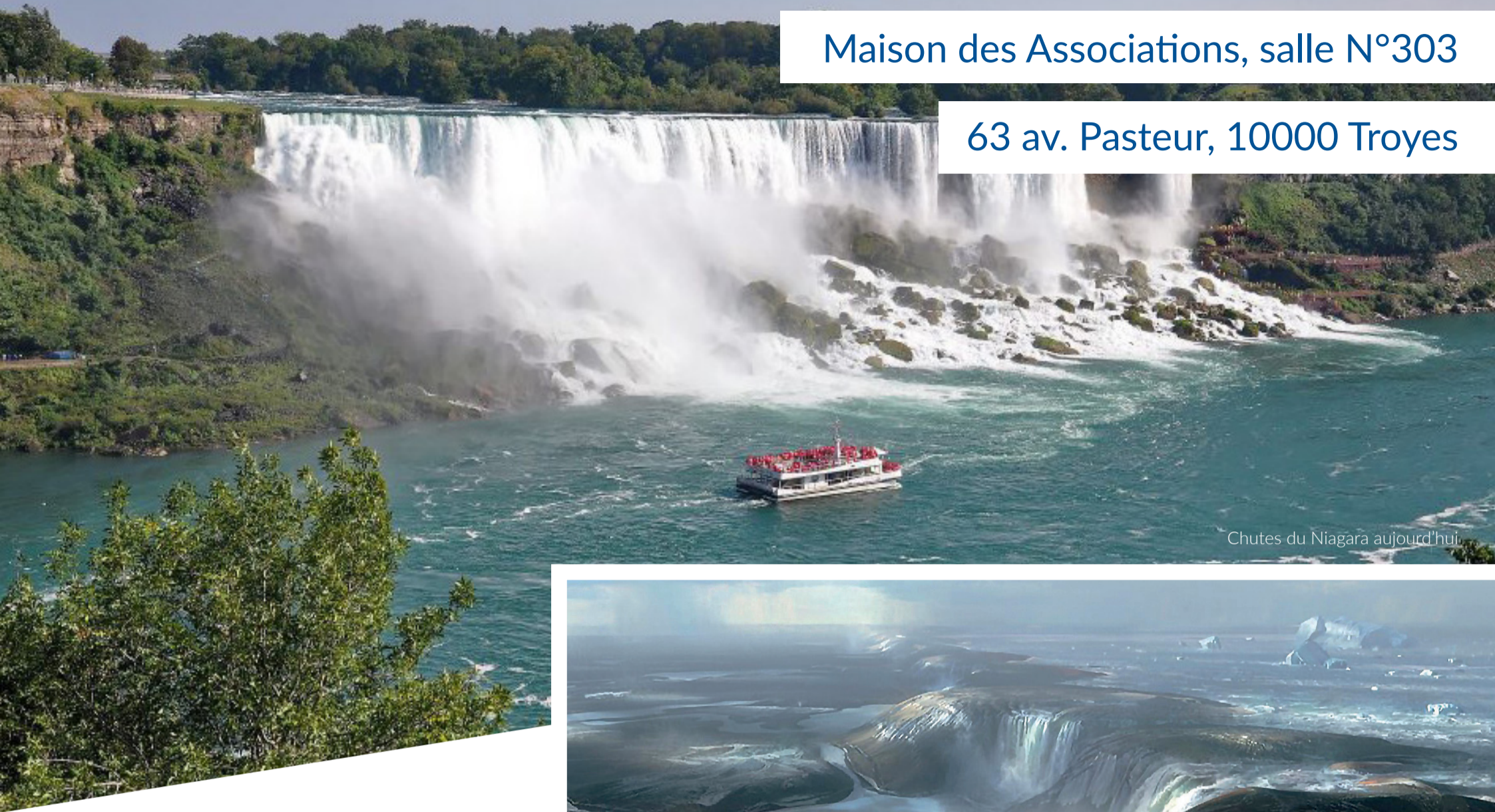
Chutes du Niagara aujourd'hui.